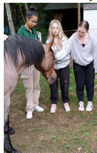
Den otevřených dveří ke 111. výročí činnosti školy