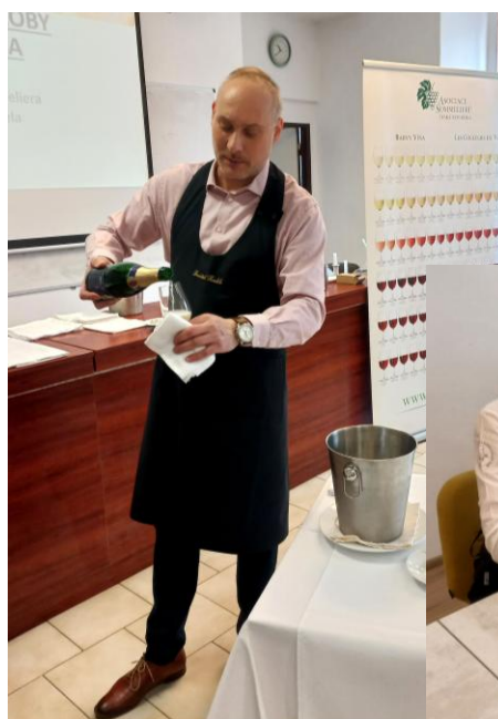
Sommeliérský kurz pro žáky školy